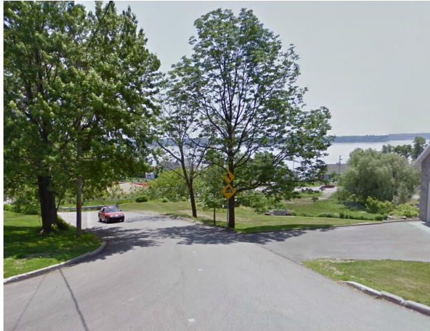
Vue du bureau du secrétariat depuis septembre 2008, à Neuville